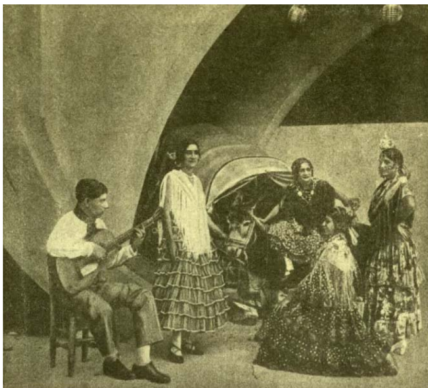
Foto 3: «En un rincón del Pueblo Español convertido en campamento de una tribu de gitanos»