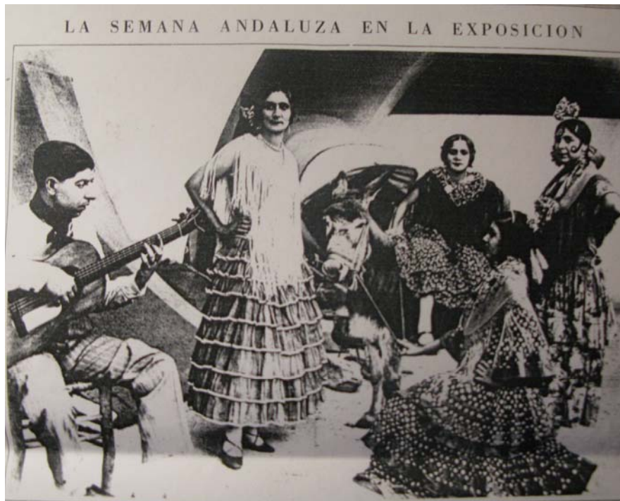
Foto 2: «Gitanas cordobesas que tomaron parte en los festivales organizados en el Pueblo Español con motivo de la Semana Andaluza»